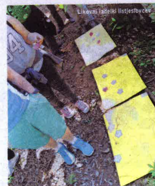
Likovni izdelki listjeslovcev