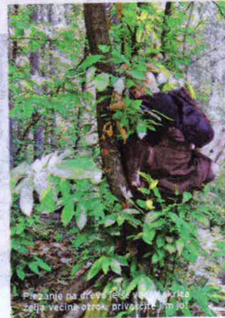
Preznanje na drve je še vedno prva želja večine otrok privlačne jim je

PRILOGA ŠOLSkih RAZGLEDOV • 16. SEPTEMBER 2016